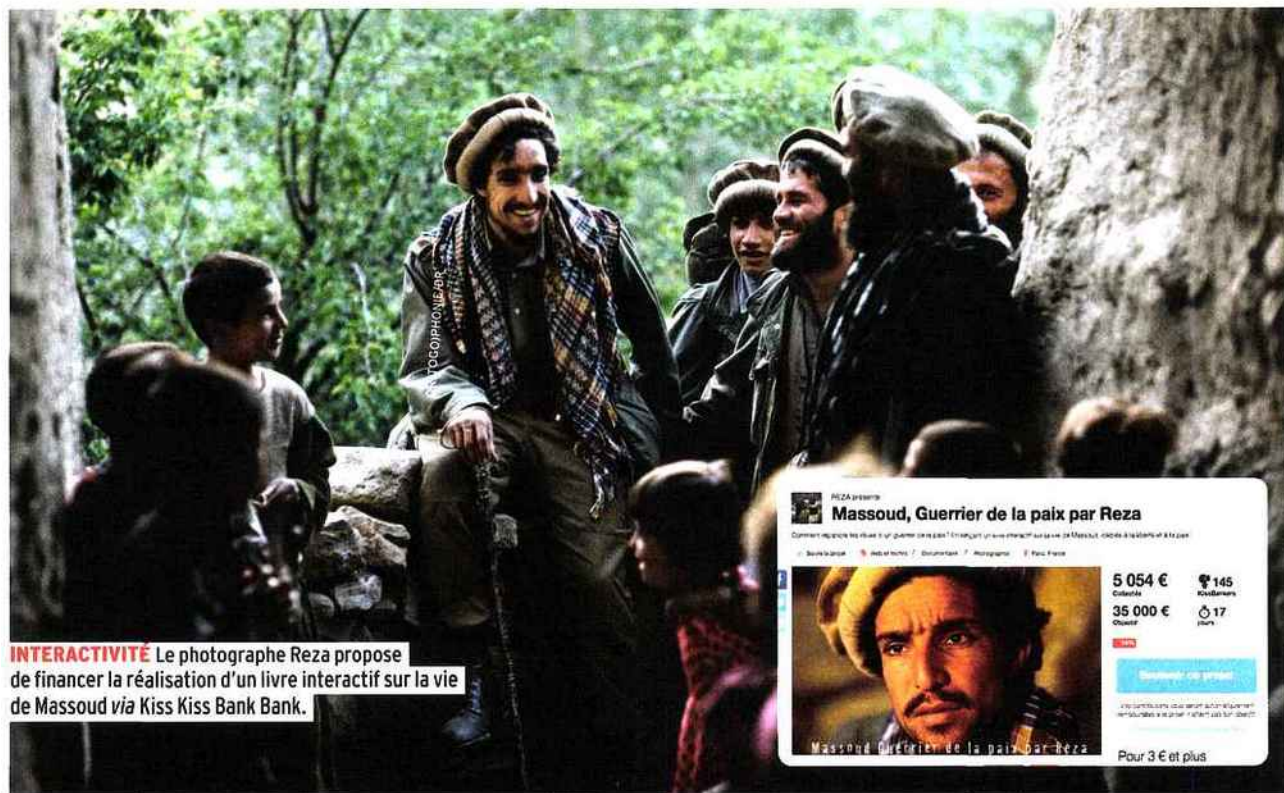
INTERACTIVITÉ Le photographe Reza propose de financer la réalisation d'un livre interactif sur la vie de Massoud via Kiss Kiss Bank Bank.