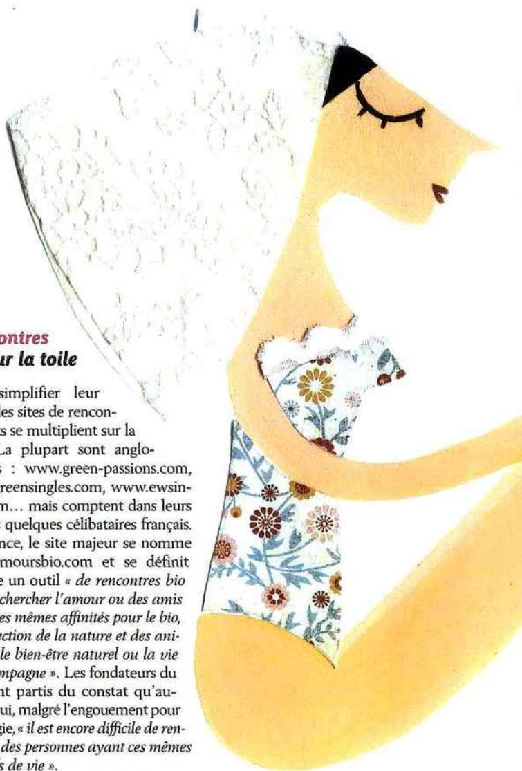
ILLUSTRATION : SUPPA/L'APIK

Colin éd.). « Être bien en couple aujourd'hui dépasse largement la question d'être ou de ne pas être bio, précise le sociologue. Si l'on a besoin de plus en plus de repères pour chercher l'âme sœur, si l'on a l'impression que le tandem fonctionne mieux avec une personne qui partage les mêmes